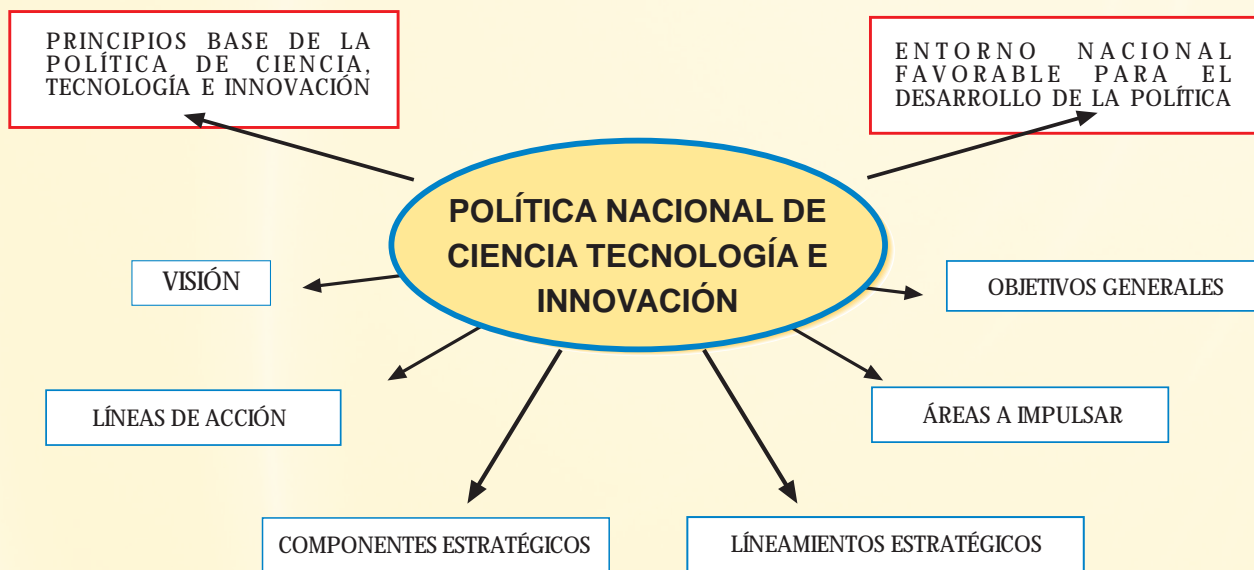
Ilustración 3. Estructura general de la Política Nacional de Ciencia Tecnología e Innovación.