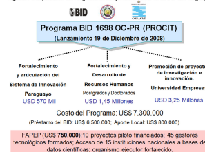
Figura 2. Componentes del Programa de Apoyo al Desarrollo de la CTI en Paraguay.