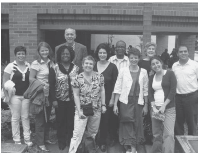
Figura 1. Participantes de la Reunión de la Red de Centros de Referencia para Capacitación en Cursos de Planeación y Evaluación Efectivas de Proyectos, Cali, Colombia, abril 26-28, 2010.

El Curso de Habilidades PEEP tiene como objetivo fortalecer las habilidades de los investigadores para la salud de países en vías de desarrollo para que alcancen con éxito la implementación de sus proyectos y el establecimiento de colaboraciones, y que estén bien posicionados para competir internacionalmente en la elaboración de propuestas de investigación. El curso proporciona las herramientas necesarias para la planeación y evaluación de proyectos y se dicta usualmente en 4 días (32 horas). La metodología del curso es la de "aprender haciendo", por lo tanto los participantes trabajan en grupos de tres personas y al final del curso han logrado avanzar significativamente la planificación de su proyecto. Cada grupo trabaja con su propio proyecto durante un 80% del tiempo del curso lo que les permite a los participantes aplicar los pasos de planeación y evaluación a su proyecto. El Curso se desarrolla a través de cinco módulos (ver Figura 2): Buenas prácticas en la investigación para la salud (teoría), Entender el concepto y valor de la planeación y evaluación de proyectos (teoría), Definir el propósito y alcance del proyecto (Fase 1, teoría y estudio de casos), Establecer el plan de desarrollo del proyecto (Fase 2, teoría y estudio de casos) y Ejecución, supervisión, evaluación y reporte (Fase 3, teoría y estudio de casos).